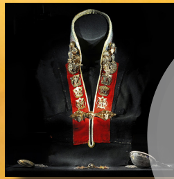
Detta hittar du i museet

7 juni - 7 augusti öppet alla dagar 09.00-18.00 Torsdagar v. 25 till v.31 öppet till 20.00