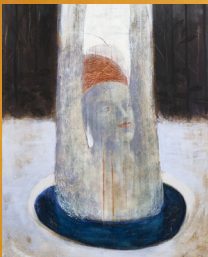
Sommarens tillfälliga utställningar