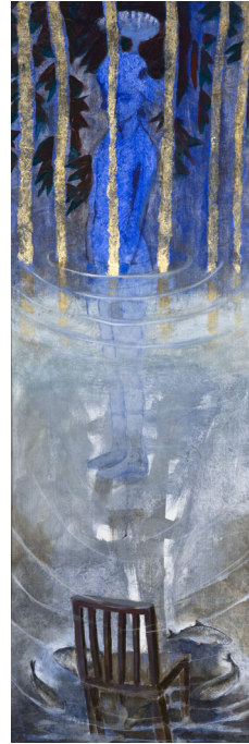
Gudrun Westerlunds tavlor Icehole och Looking at fish- whitefish