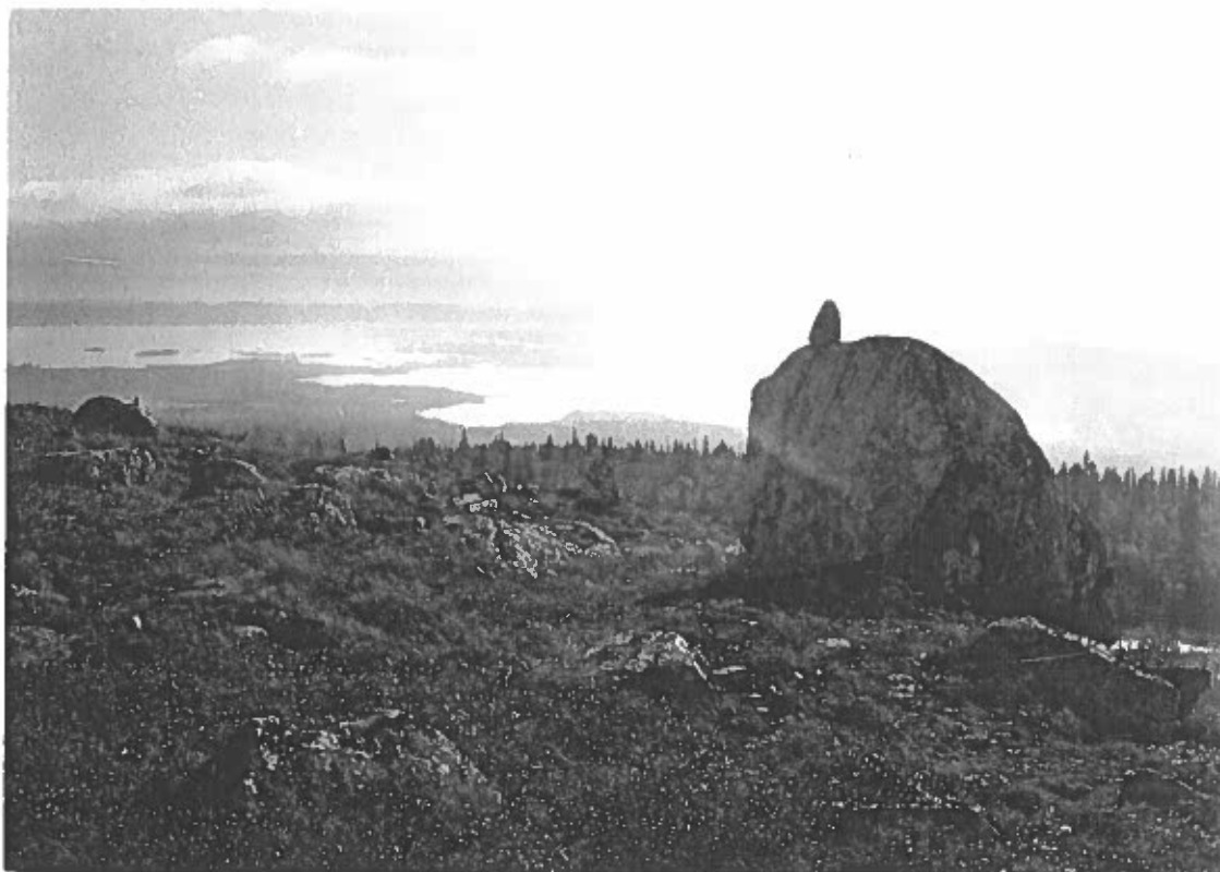
Bild 3 Lämning nr 6, rösning ovanpå block. I bakgrunden syns Uddjaurs södra del. Foto fr NNV, av L. Liedgren, 2001.