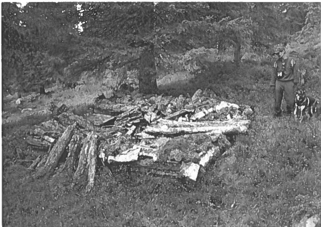
Bild 6 Lämning nr 17, kåta. I bildens högra kant syns Lennart Jonsson, Maskaur sameby. Foto av L. Liedgren, 2001.