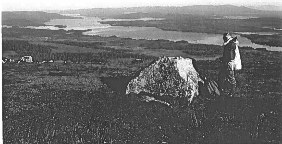
Bild 2 Lämning nr 3, rösning ovanpå block. Utsikt mot Dainakbron, till vänster är Lennart Klang. Foto fr SSÖ, av L. Liedgren, 2001.