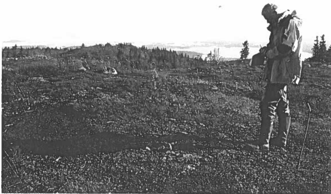
Bild 4 Lämning nr 8, härd. Härden syns till vänster om L. Klang och hitom skugga. I bakgrunden syns södra delen av Uddjaur. Foto fr NNV, av L. Liedgren, 2001.