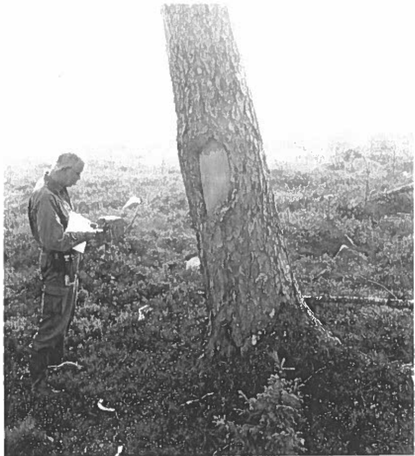
Bild 5 Lämning nr 10, barktäkt. Till vänster om träd är L. Klang. Foto av L. Liedgren, 2001.