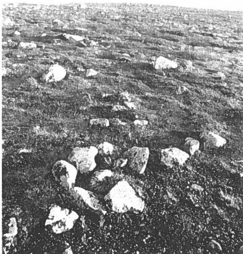
Bild 1 Lämning nr 1. I bildens centrum är den E-formade stensättningen. Foto fr NNV, av L. Liedgren, 2001.