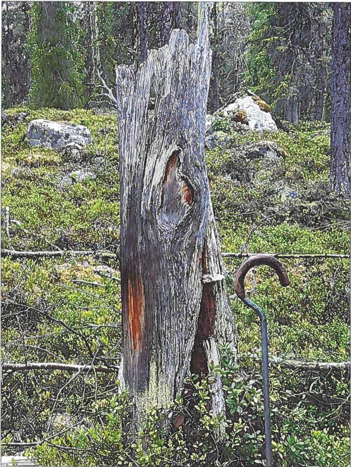
Foto 3. Stubbe med bläcka (nr 15) med spår efter fyra yxhugg.