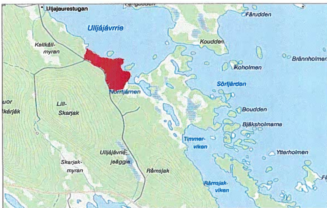
Figur 1. Översiktskarta över Uhta Skárjåk. ©Lantmäteriet 2018, dnr I2018/00073. Det besökta området markeras med rött.

Silverbuseet har under våren 2019 medverkat i ett projekt med titeln "Skyddad natur för tillväxt", som var ett samarbetsprojekt mellan Länsstyrelsen i Norrbotten (naturvårdsenheten), Arjeplogs kommun och Silverbuseet. I samband med arbetet genomförde Silverbuseet besiktnings- och avseende på kulturspår i två reservat, Knutberget samt ett delområde längs Veijeströmmen inom Laisdalens fjällurskogs naturreservat. Syftet var att bedöma och dokumentera förekomsten av eventuella kulturspår. Med anledning av Svea skogs planerade avverkning i ett område Ö om Uhtsa Skárjåk/Lill-Skarjak, i direkt anslutning till det planerade reservatet vid Stuor-Skárjåk/ Stor-Skarjak, bedömdes en kulturhistorisk inventering vara påkallad. Inventeringen omfattade såväl kultur- och fornlämningar på mark och dels kulturspår i träd. Området inventerades vid två tillfällen, den 30/4 samt den 28/6.