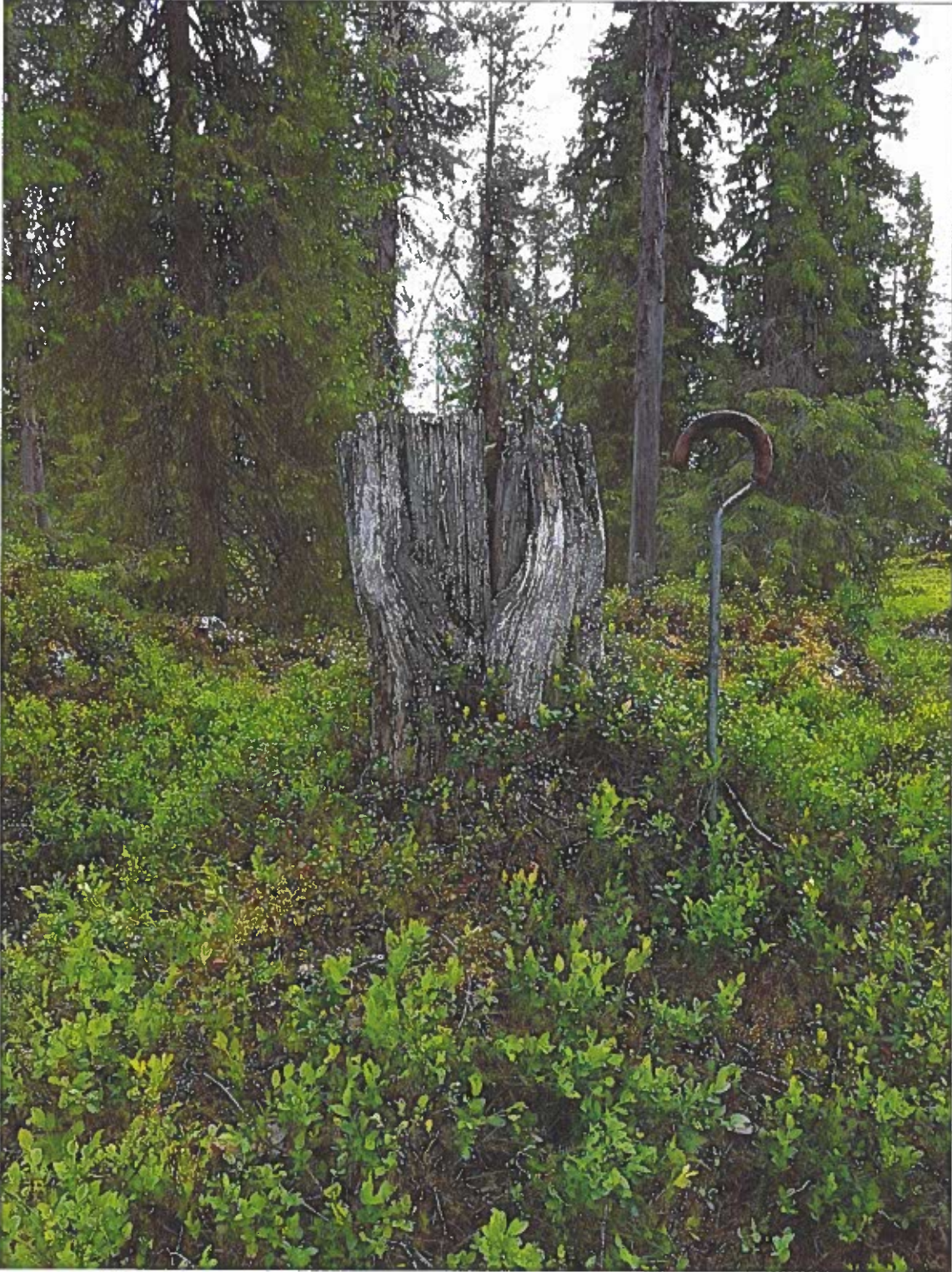
Foto 1. Stubbe med barktäkt (nr 12). Barktäktens form och läge ovan mark visar att innerbarken skördats som föda.