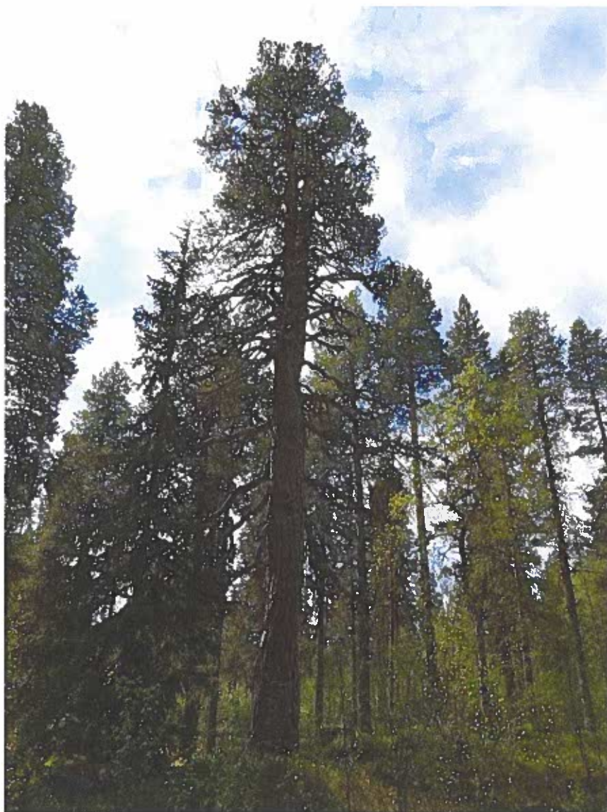
Bild 4 Gammal tall i anslutning av brukningsväg.