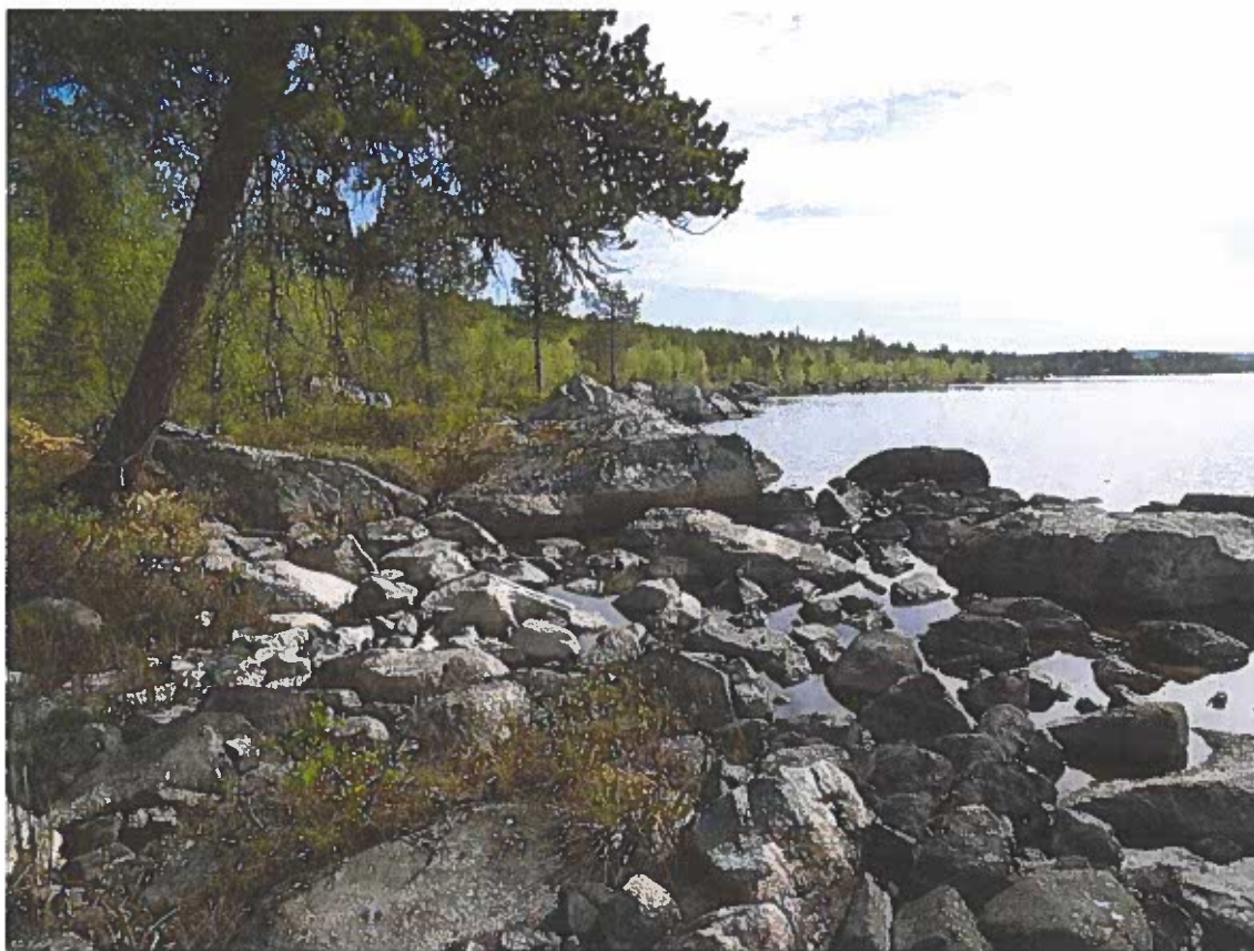
Bild 3 Steniga strandpartier i områdets Ö del, fr V. Foto av L. Liedgren, 2013.