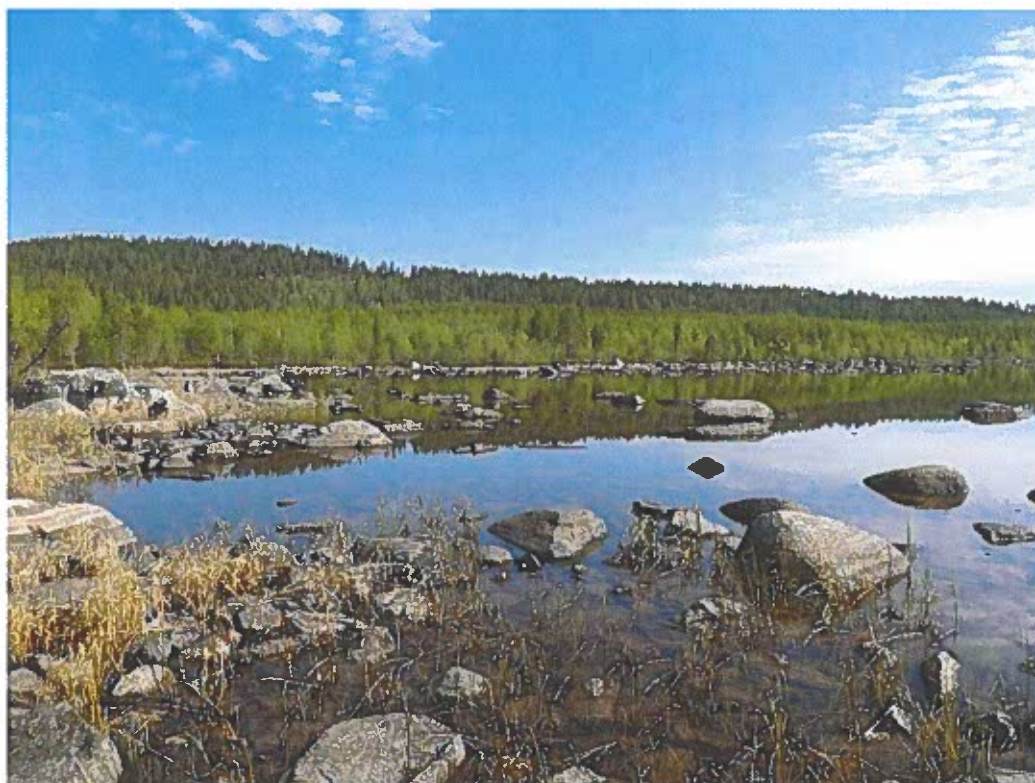
Bild 1 Översiktsbild mot contortaodling i utredningsområdets NV del, fr SV.