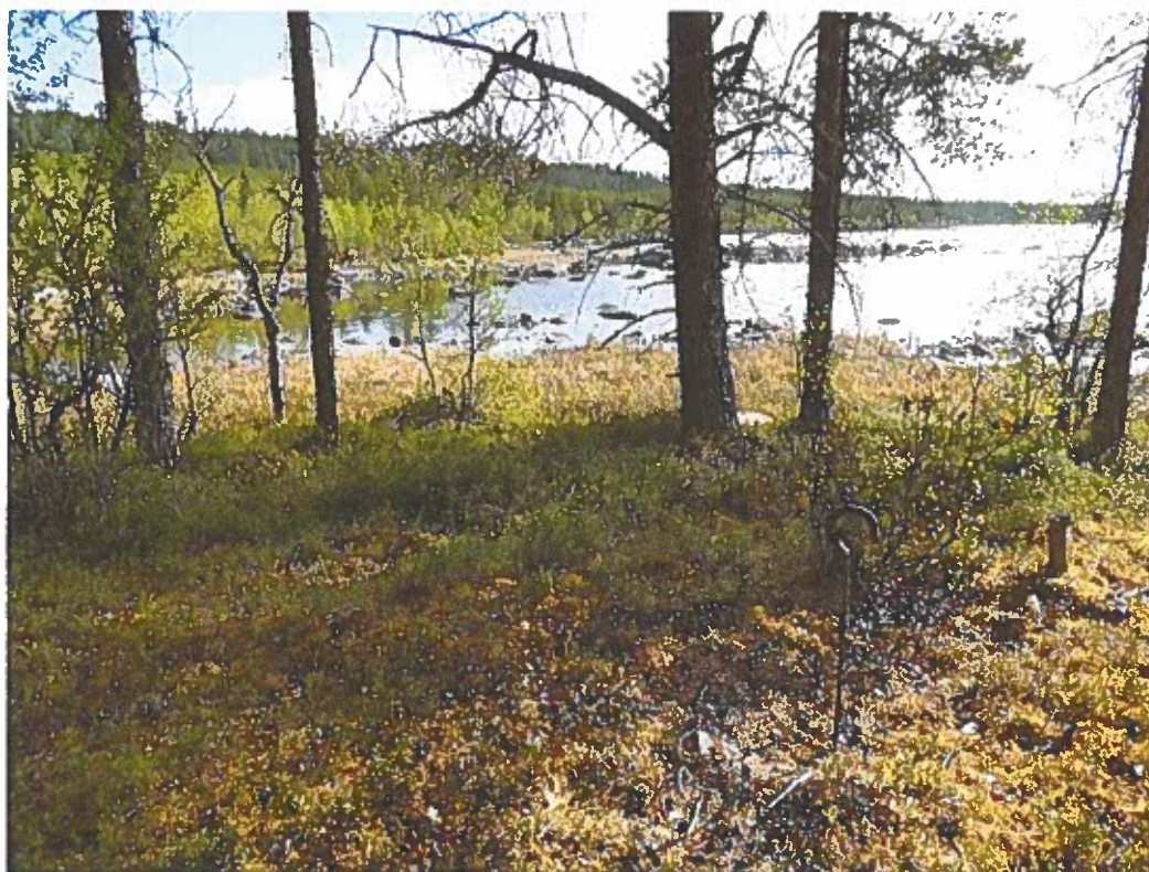
Bild 2 SMA 1, härd, fr VSV . Sonden står i kanten av härden.