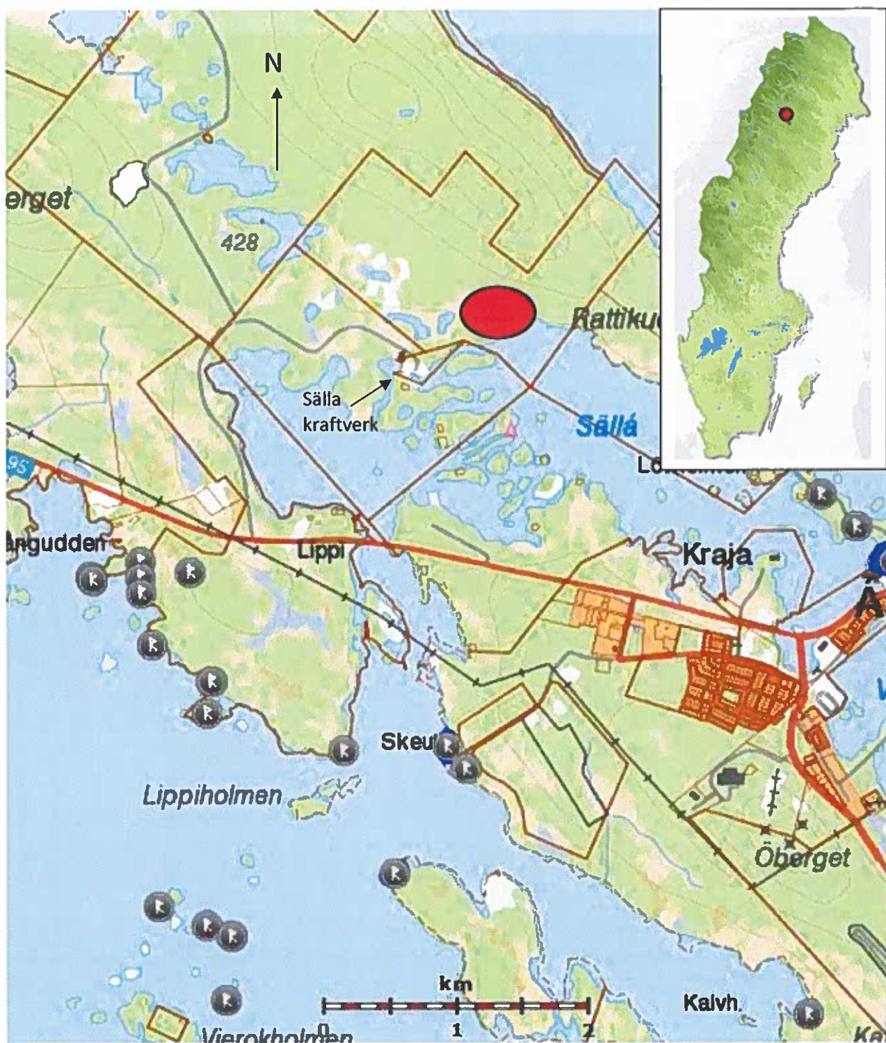
Fig. 1 Undersökningsområde markerat med rött. Karta efter FMIS skala 1:40 000.