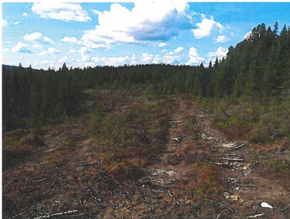
Fig. 1 Bild över mellersta partiet av utredningsområdet, fr. SÖ.

Undersökningen genomfördes i enlighet med ovanstående utgångspunkter. Den kvarlämnade veden och kvistarna erbjöd inga större problem för genomförandet av uppdraget. Någon spadning bedömdes ej vara nödvändig.