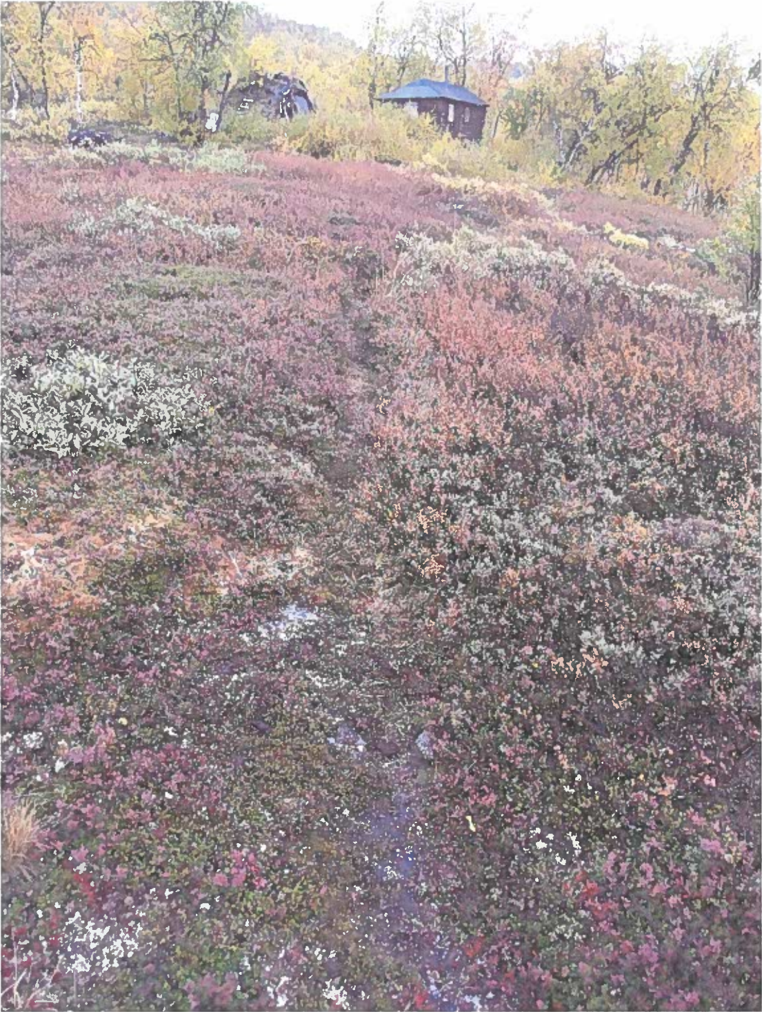
Bild 1 Foto av påträffad härd. Härden ligger i förgrunden i stig och markeras av några stenar.